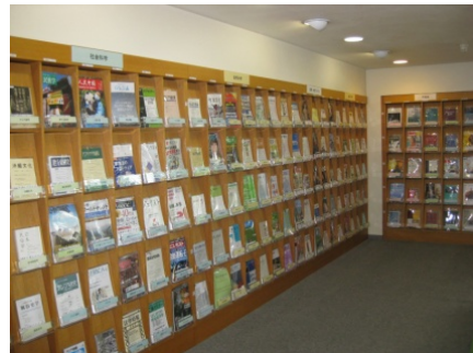
※8 雑誌配架位置リスト