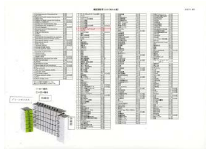
※8 の部分拡大（赤色部分）