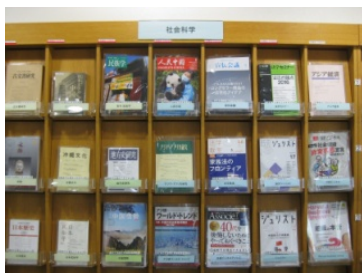
※9 の部分拡大（赤色部分）