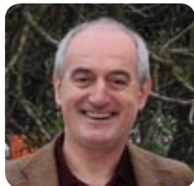
アレッサンドロ・ヴェントゥーリ氏 イタリア政府教育省の認定教育機関である、イタリア味覚教育センター代表。1990年代より、イタリア式味覚教育の基礎を築いた。