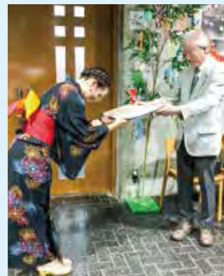
神田学長より修了証授与