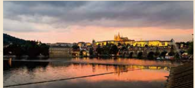
チェコ・プラハのカレル橋あたりからの景色