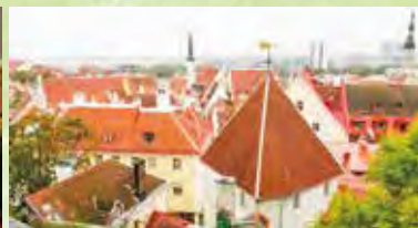
世界遺産に登録されているタリン歴史地区(旧市街)