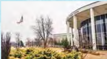
キャンパスの中心にある学生会館