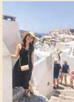
ギリシャのサントリー二島

留学して変わったことは、何事も、“何となく”ではなくて自分の意思や理由を持って行動できるようになったことです。一人で生活しているからこそ、今は何がしたいのか、何をすべきなのかを第一に考えて動くようになったと感じています。