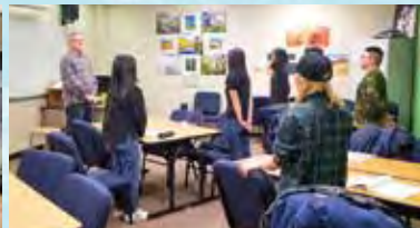
少人数で行われるESLの授業風景