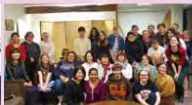
毎週活動しているJapanese Club