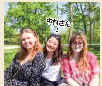
よく散歩に行く公園でルームメイトとピクニック