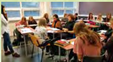
日本語学科の授業風景