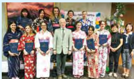
今回帰国する協定留学生