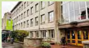
大学の建物にはTerra(地球)、Astra(星)などの名前がついている 図書館

エストニアの首都・タリンの、伝統的なヨーロッパの街並みが美しい旧市街からほど近くに位置しています。協定留学生が住む寮は大学から徒歩5分ほどのところにあり、近くにスーパーやデパートなどもあるのでとても便利です。バスやトラムなどの公共交通機関も充実していて、生活しやすい環境です。タリン大学の学生が留学生をサポートするチューター制度があり、生活や勉強のことなどなんでも相談できます。