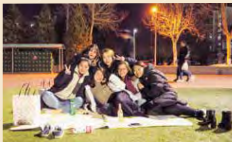
大学のグラウンドで友人の誕生日をお祝い