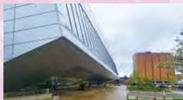
劇場やスタジオを備えたWolf Center