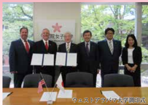
ウェストアラバマ大学調印式

ウェストアラバマ大学との学生交換協定は 2017年 6月 16日に本学において調印式を行い、発効いたしました。同大学は 1835年に創立された、アラバマ州リビングストン市にある州立大学です。経済学部、教育学部、教養学部、理学部、看護学部の5学部からなります。アメリカ国内でも安全なキャンパスの一つで、アラバマ州の安全なキャンパスランキングで第1位にも選ばれています。近年、海外の協定校を増やしており、国際交流に力を入れています。