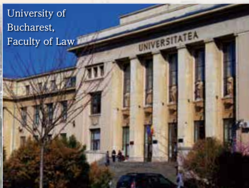
University of Bucharest, Faculty of Law