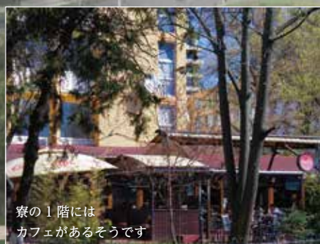
寮の1階にはカフェがあるそうです