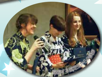
帰国する協定生からの挨拶