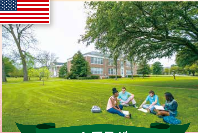
ウェストアラバマ大学

ウェストアラバマ大学との学生交換協定は 2017年 6月 16日に本学において調印式を行い、発効いたしました。同大学は 1835年に創立された、アラバマ州リビングストン市にある州立大学です。経済学部、教育学部、教養学部、理学部、看護学部の5学部からなります。アメリカ国内でも安全なキャンパスの一つで、アラバマ州の安全なキャンパスランキングで第1位にも選ばれています。近年、海外の協定校を増やしており、国際交流に力を入れています。